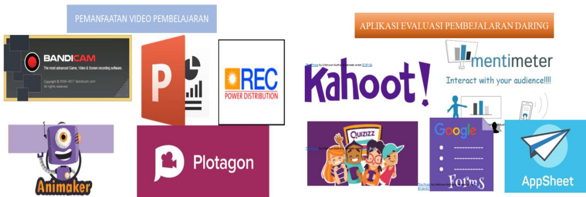
Gambar 3. media pembelajaran